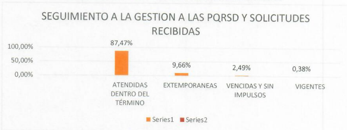
Gráfico 7: GESTIÓN A LAS PQRSD Y SOLICITUDES RECIBIDAS DURANTE EL AÑO 2022