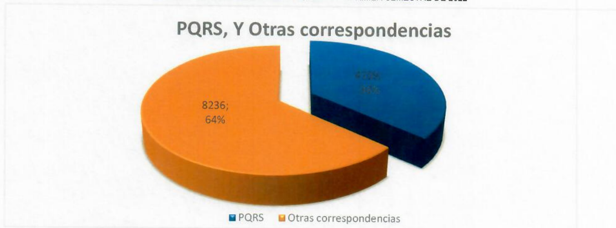
Gráfico 1: PARTICIPACIÓN DE LAS PQRSD EN EL PRIMER SEMESTRE DE 2022