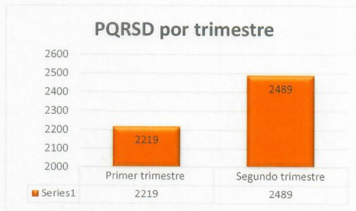
Gráfico 4: DISTRIBUCIÓN TRIMESTRAL DE LAS PQRSD Y SOLICITUDES RECIBIDAS DURANTE EL 2022